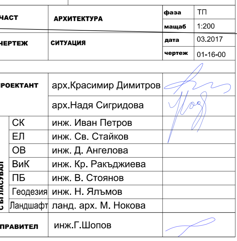
СИТУАЦИЯ М 1:200

ИНВЕСТИЦИОНЕН ПРОЕКТ ОБЕКТ: ЖИЛИЩНА СГРАДА С ОФИС И ПОДЗЕМНИ ГАРАЖИ в УПИ V - 467, кв. 82, м. "ж.к. Красно село - Стрелбище", гр. София